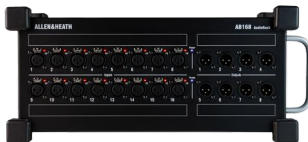
Allen Heath AB168

16 entrées 8 sorties analogiques symétriques XLR