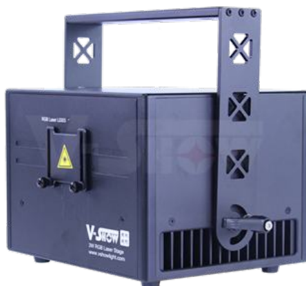
Laser RGBL 3W