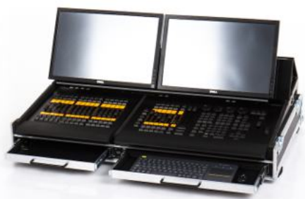
GrandMa PC Wing