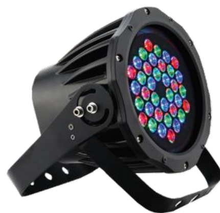
PAR LED IP65 GT022