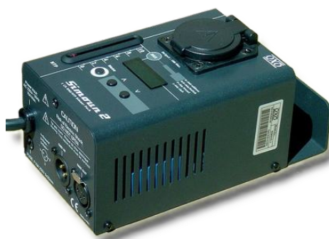
Bloc Simoun 1X 1kw