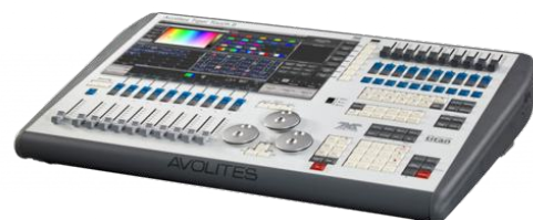
AVOLITE TingerTouch II