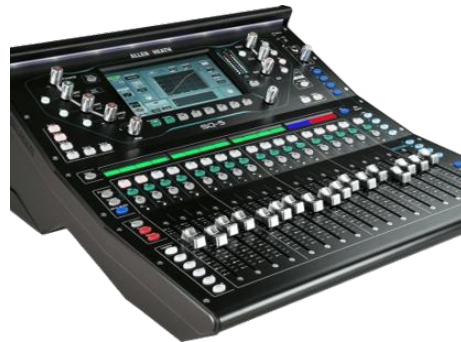
SQ5 Allen Heath