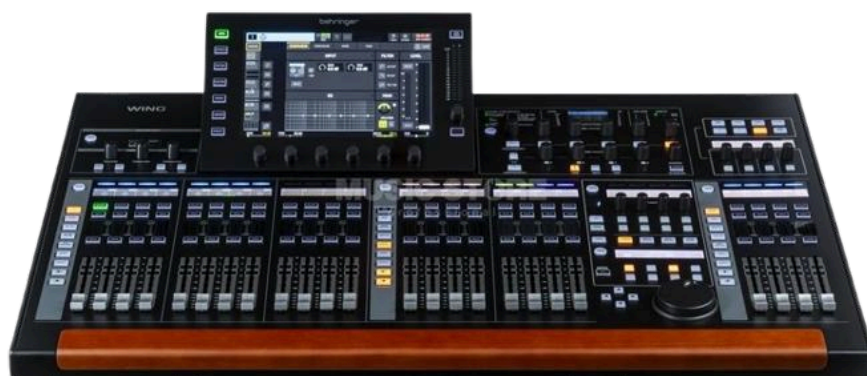
Behringer wing 48