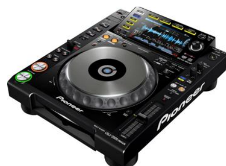
CDJ 2000 NX