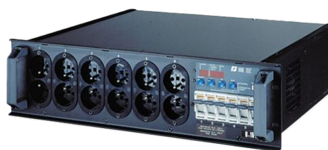
Bloc 6X 2000w