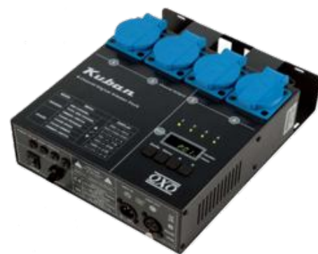
Bloc 4X 1100W