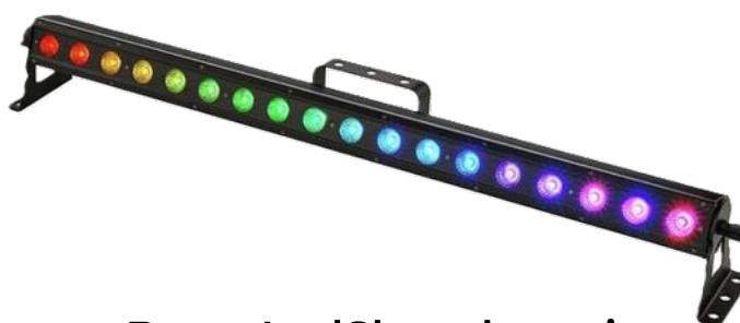
Barre LedShow bar tri