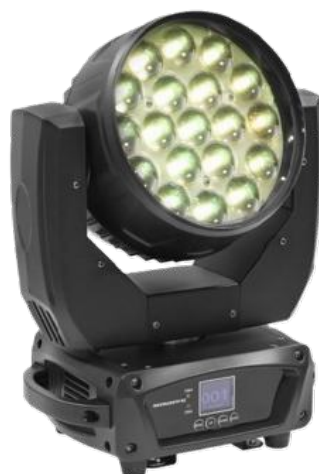
Lyre wash Mac