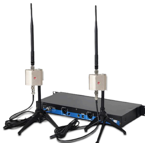
Mini antenne micro