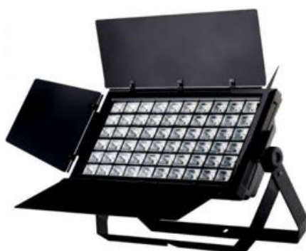
PAD 180: 180 led 3W