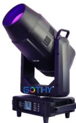
Lyre 800W Led

Spot : 7 couleurs, 8 gobos statique, 6 gobos rotation, prisme 3 F