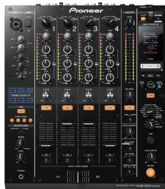
DJM 900 Nexus 2