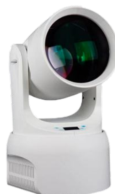
LYRE BEAM 180W LED