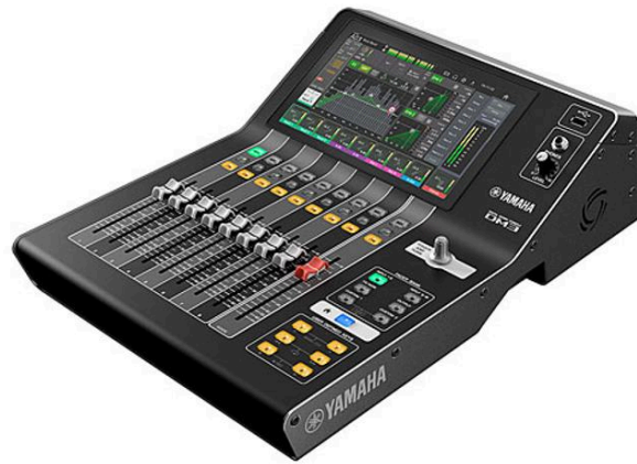
DM 3 Yamaha