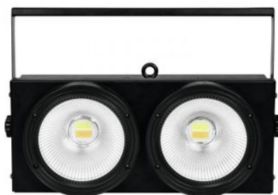
Blinder Cob 2 X 100W