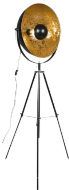
MAGNA Eglip vintage 50 cm