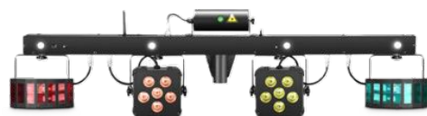
Barre Effet FX