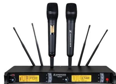
Sennheiser SKM 9000