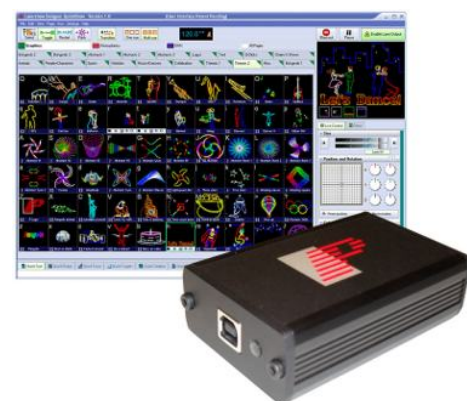
Contrôleur Pangolin quickshow