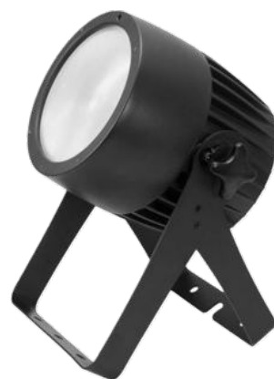
Projecteurs Théâtre IP65 200W Zoom