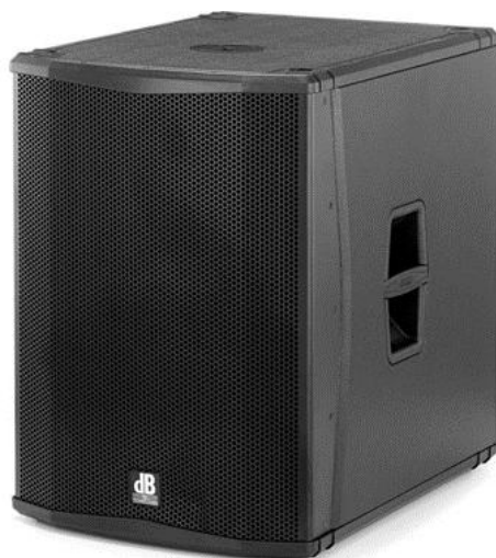
Sub H18 & H15

2000W 134db Dim 524 X 711 X 695mm 41,4kg