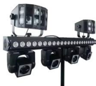
Barre Effet Lyre beam