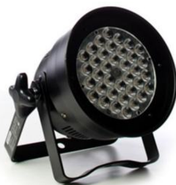
PAR LED 56