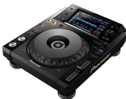
XDJ 1000 MK2