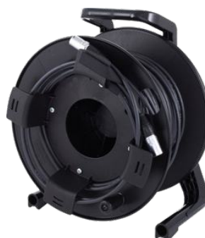
Câble CAT5 sur enrouleur