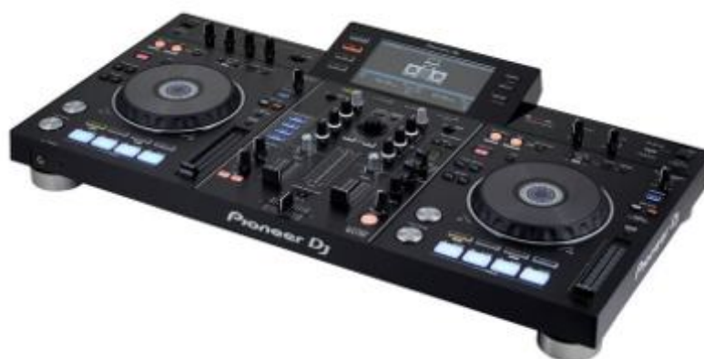
Contrôleur XDJ RX2