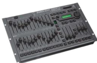
LC 2412 FX 3D