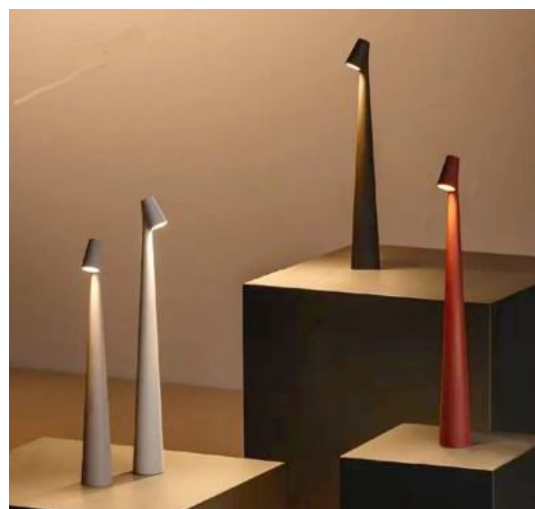
Lampe coloris blanc