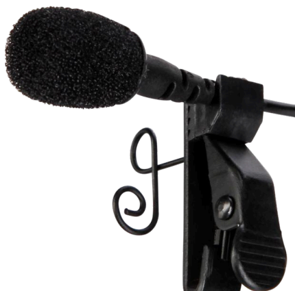
Micro col de cygne