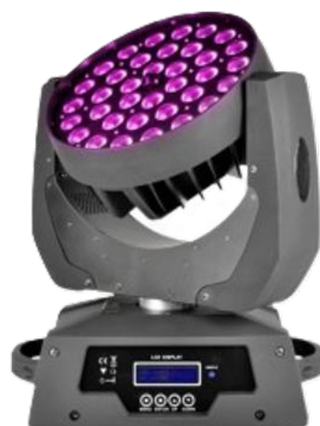
Lyre Wash 3610