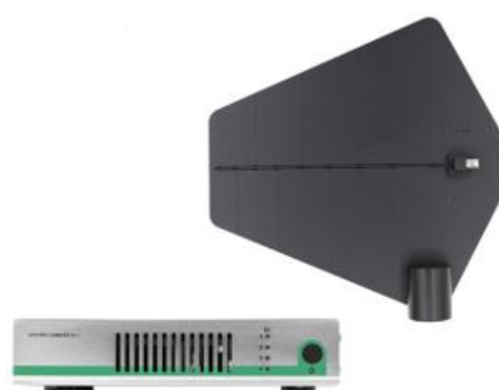
Amplificateur In ar monitor