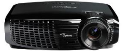
Vidéoprojecteur 6000 LUM Vidéoprojecteur 3000 Lum