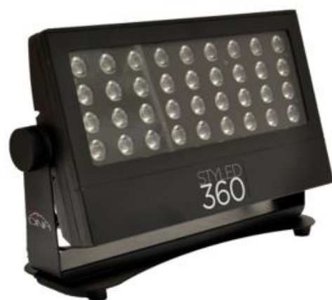
STYLED 360: I65P