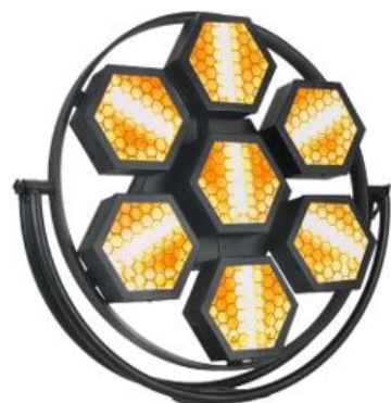
Eclairage Led rétro

Eclairage LedFunstrip rétro 6 X 50W blanc chaud Cob