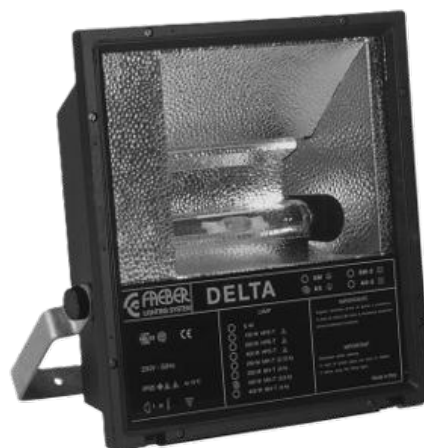
Projecteurs L'iodure: 400W /200W