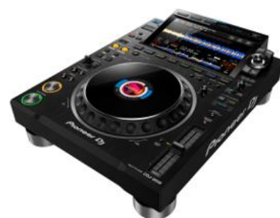
CDJ 3000 NX