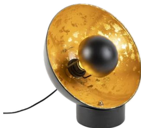
MAGNA Eglip vintage 20 cm