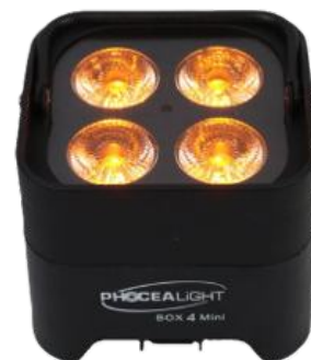
BOX 4 Mini: projecteur led

BOX 4 Mini: projecteur led batterie 4X 15W RGBWA+UV