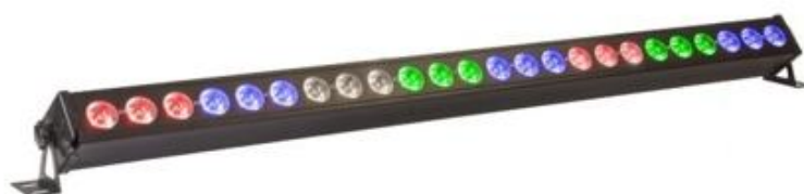
Barre Led pixel