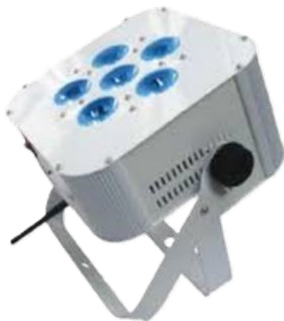
Flat 6 : projecteur led

Flat 6 : projecteur led batterie 6X 10W RGBWA+UV