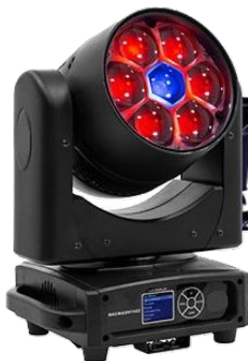
Lyre Wash 740