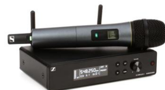
Sennheiser XSW2-865 G3 W100-835