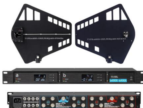
Splitter antenne UHF