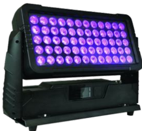
CITY COLOR: IP65