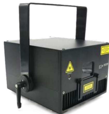
Laser RGBL 6W