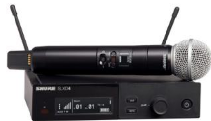
Shure SLXD4 Beta 58