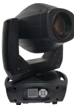
LYRE 200W LED BSW