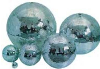
Boule à facette 75cm 50cm 30cm