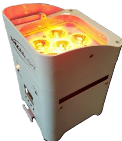
BOX 6: projecteur led

BOX 6: projecteur led batterie 6X 15W RGBWA+UV