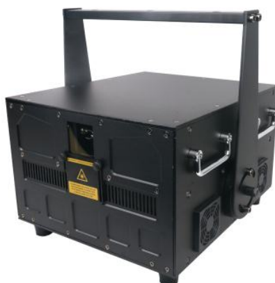
Laser RGBL 15W