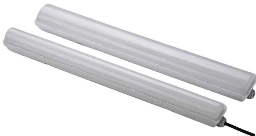
Réglette LED 30w