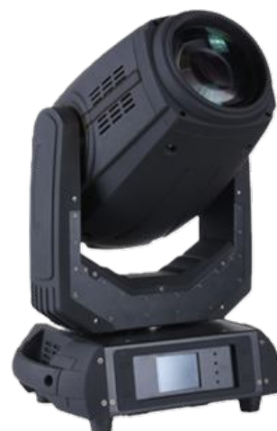
LYRE POINTE 280W 10R