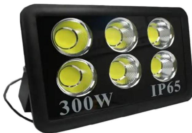
Pannel IP65 300W: blancchaud/froid