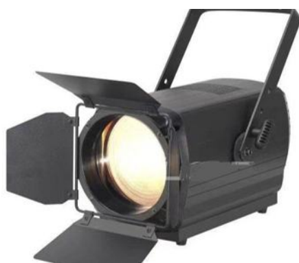
Projecteurs Théâtre 300W Zoom