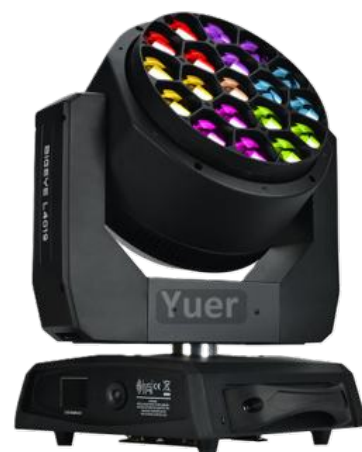
Lyre Wash Bee eye