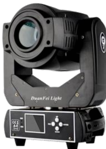
LYRE 90W LED