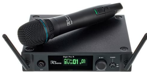
T-Bone free solo HT 1.8 GHz