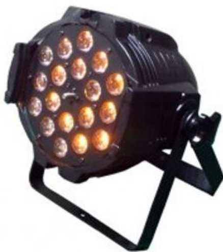
PAR LED 18X12W