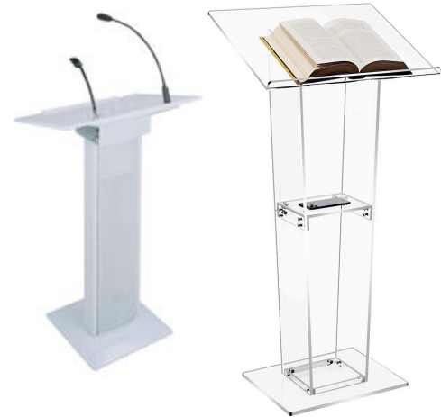
Pupitre de discours : blanc et plexi