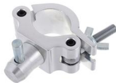
Collier et Crochet