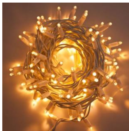
Guirlande ciel étoilé