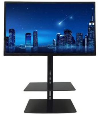
TV Led 4k : 42/ 55/ 65/ 85 pouce