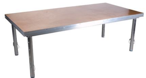
Scène 2M X 1M