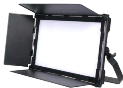
Pannel led soft light